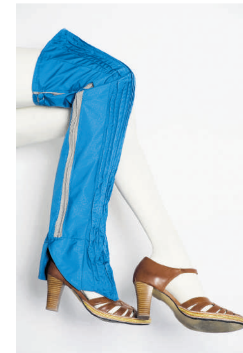
Beenkappen houden de broek of panty's droog. Met hakken eronder staat het nog sexy ook