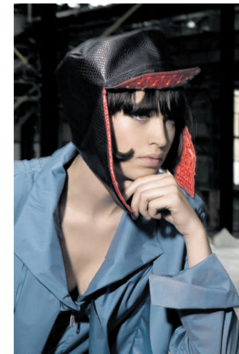
De hoedjes passen niet één op één bij de jassen, dat wordt te veel